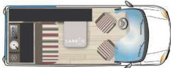
Schéma NUIT : x places